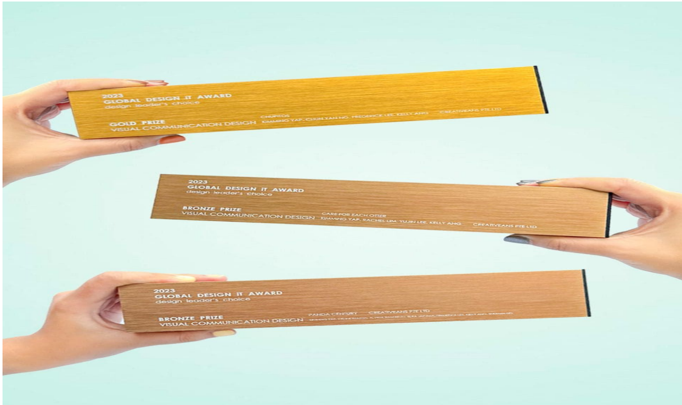
Creativeans Meraih Tiga Kemenangan di Global Design iT Award 2023

Creativeans Three Winning Projects at Global Design iT Award 2023.